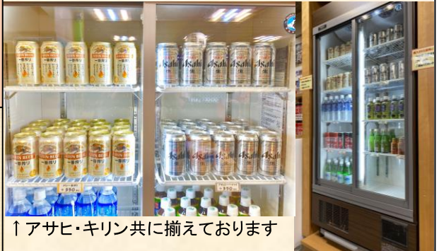
↑アサヒ・キリン共に揃えております

2019年11月より売店に大型冷蔵庫が新登場です。もともと天然水や緑茶・清涼飲料水などを入れていた小さな冷蔵庫はあったのですが、お酒は常温の日本酒や焼酎があるのみ。館内自販機にもお酒の販売はなかったため、「館内にもビールはないの？」とのお問合せも多かったのです（お部屋の冷蔵庫には瓶ビールなど用意しています）。 大型冷蔵庫・常温のお酒と並んで人気の「おつまみバイキング」コーナーもごさいますので合わせてご利用下さいませ。食事処や宴会場では、売店商品のお持ち込みはご遠慮頂きますようお願いいたします。