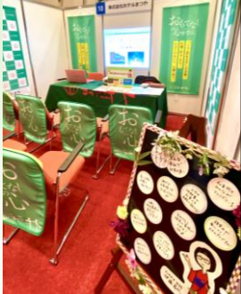
↑就活イベントの飾りつけ