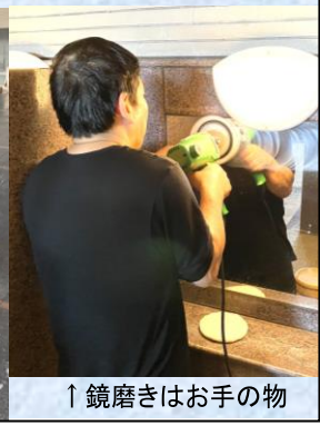
↑鏡磨きはお手の物